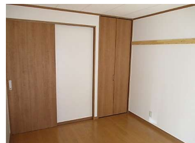
◀ before ▶